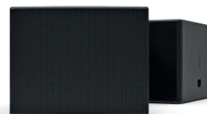
L20 Version Installation

La version Installation possède un tissu acoustique tendu, des connecteurs rapides et un nombre réduit de poignées.