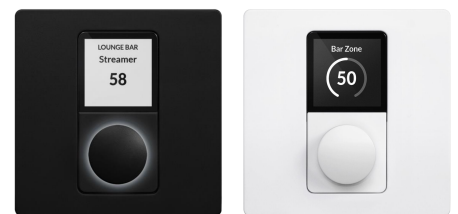
Contrôleurs muraux (Format UE)

Le nanoNXAMP4 peut prendre en charge jusqu'à 8 contrôleurs muraux. Ces contrôleurs muraux se connectent au même réseau Ethernet que le nanoNXAMP4 et sont alimentés par POE. Ils permettent de sélectionner n'importe quelle source d'entrée et de régler le volume de chaque canal de traitement de l'amplificateur. Ils sont disponibles en blanc ou en noir, format UE ou US.